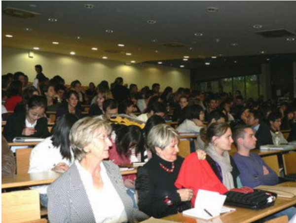
Une vue de la salle dans laquelle les membres du Cercle et leurs amis cotoyaient les étudiants et étudiantes en Master I et II de l'IUP Management.