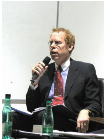
Harry Sullivan, Consul des Etats-Unis, expose la situation américaine.