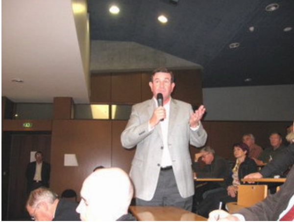
Question de la salle ....